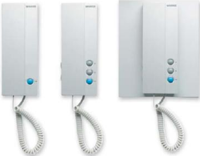
Τηλέφωνο με διακοσμητικό πλαίσιο